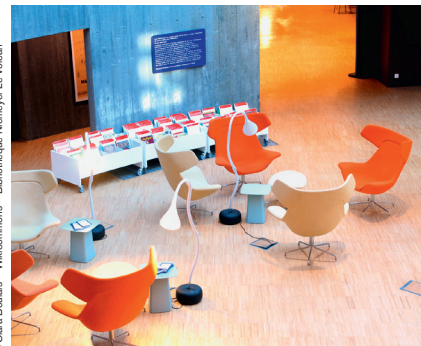
© Clara Boullé - Wikimedia - Bibliothèque Niemeyer Le Volcan

Reconstruit en 1958 sur son emplacement d'avant guerre, l'imposant bâtiment surmonté d'une tour de 18 étages est représentatif de l'architecture d'Auguste Perret. Le style classique se traduit par une organisation verticale des niveaux de l'édifice, la présence de poteaux qui soutiennent les dalles en béton, les colonnes, une toiture en terrasse. Dans l'axe de la rue de Paris, l'Hôtel de Ville ouvre sur une immense place, l'une des plus grandes d'Europe, composée de jardins et de bassins.